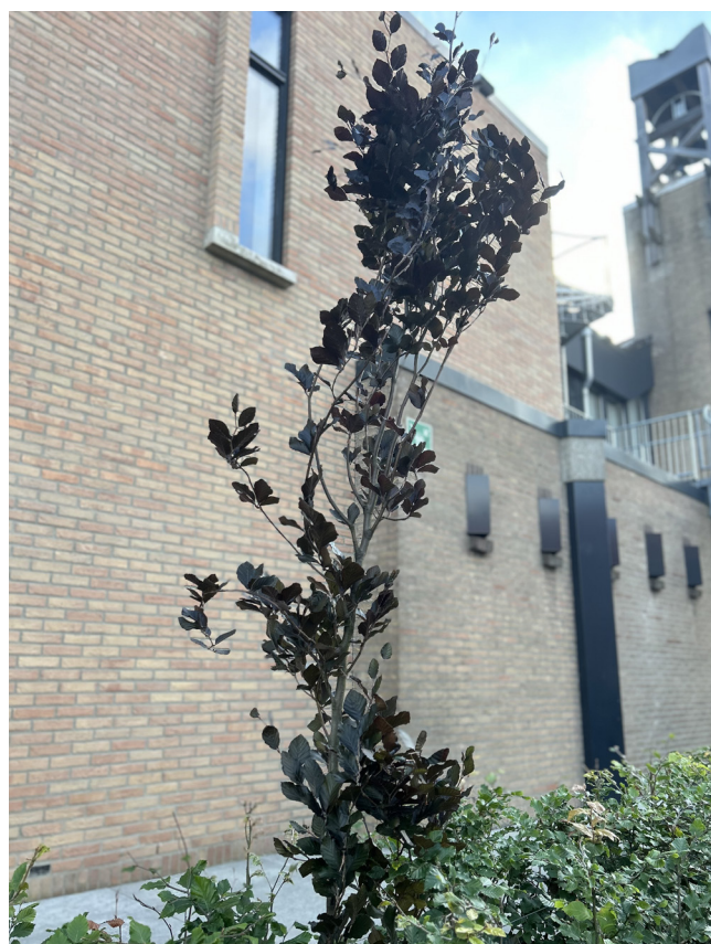
Zuilbeuk - Fagus sylvatica 'Dawyck Purple'