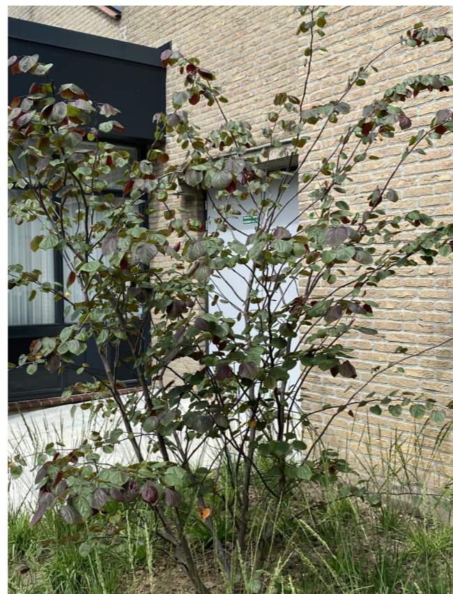
Judasboom - Cercis canadensis 'Forest Pansy'