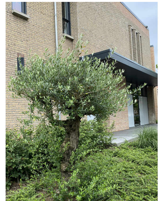
Olijf - Olea europaea