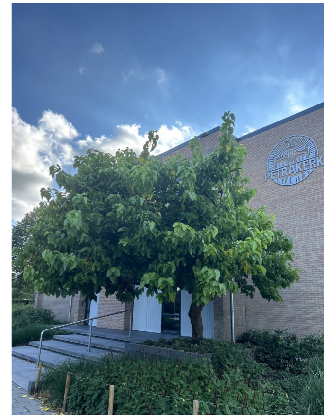
Moerbezieboom - Morus Alba