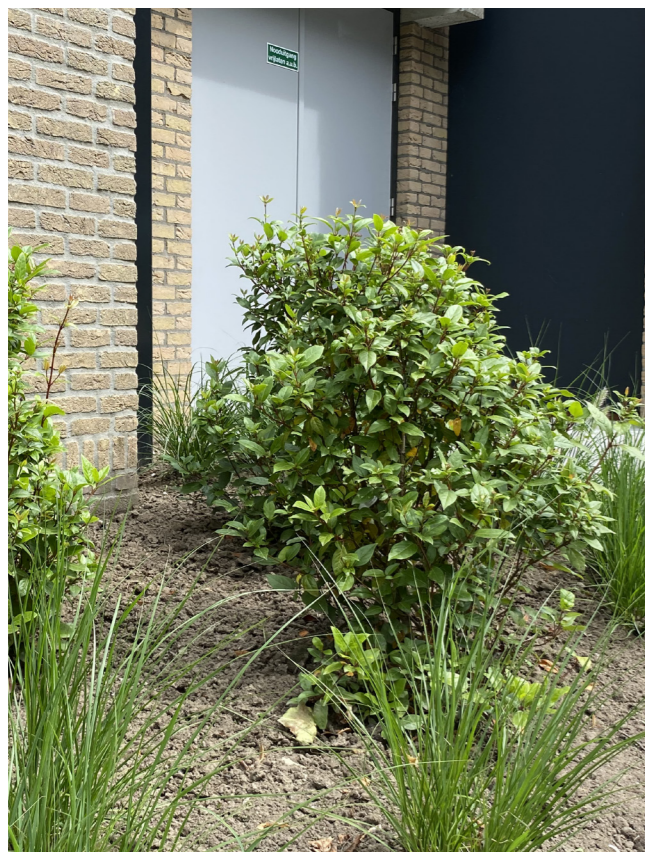
Sneeuwbal - Viburnum tinus