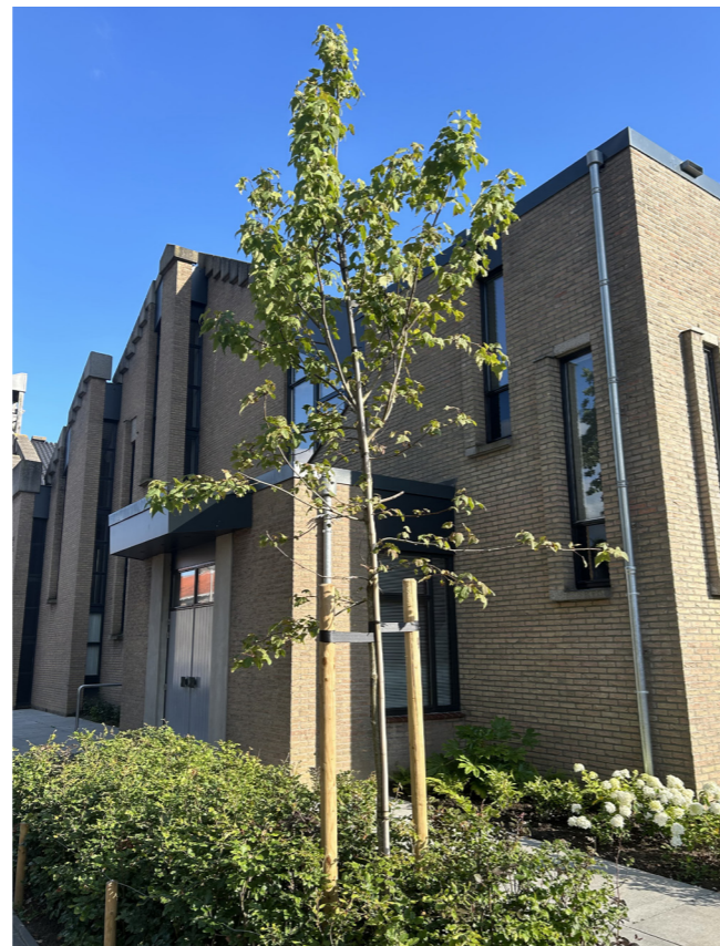
Amberboom - Liquidambar orientalis

Bij de aanplant van de tuin is gezocht naar bomen die in de Bijbel ook voorkomen of een naam hebben die naar de Bijbel verwijst. In deze brochure is een aantal foto's van deze bomen opgenomen.