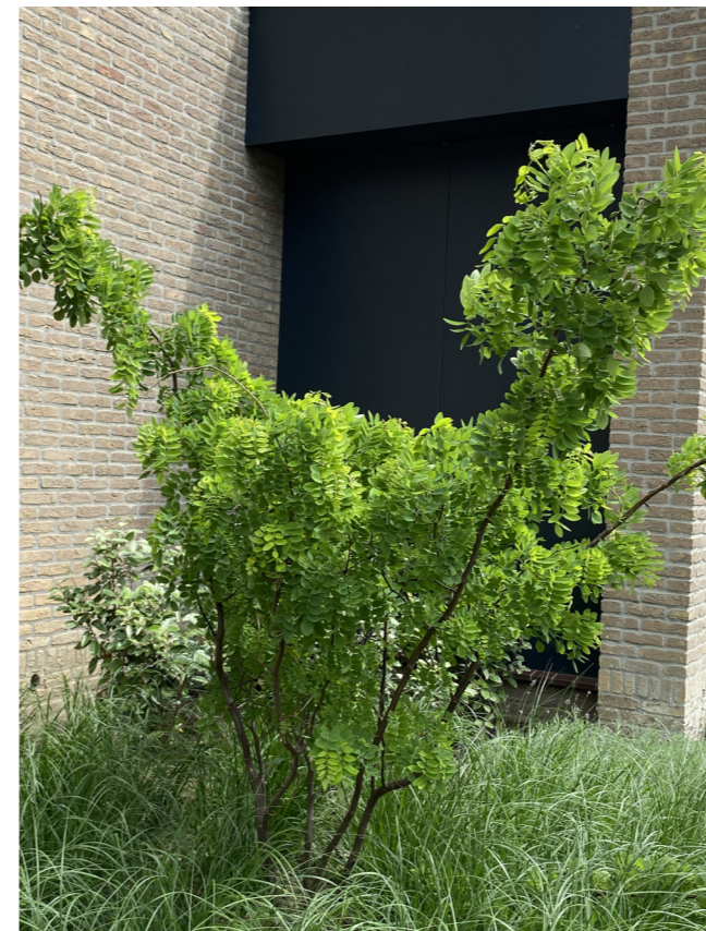
Kronkelacacia - Robinia pseudoacacia 'Tortuosa'