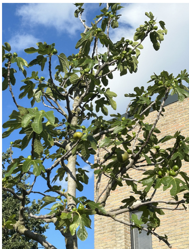
Vijg - Ficus carica