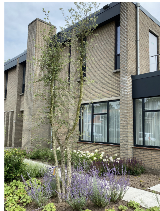
Kurkeik - Quercus suber